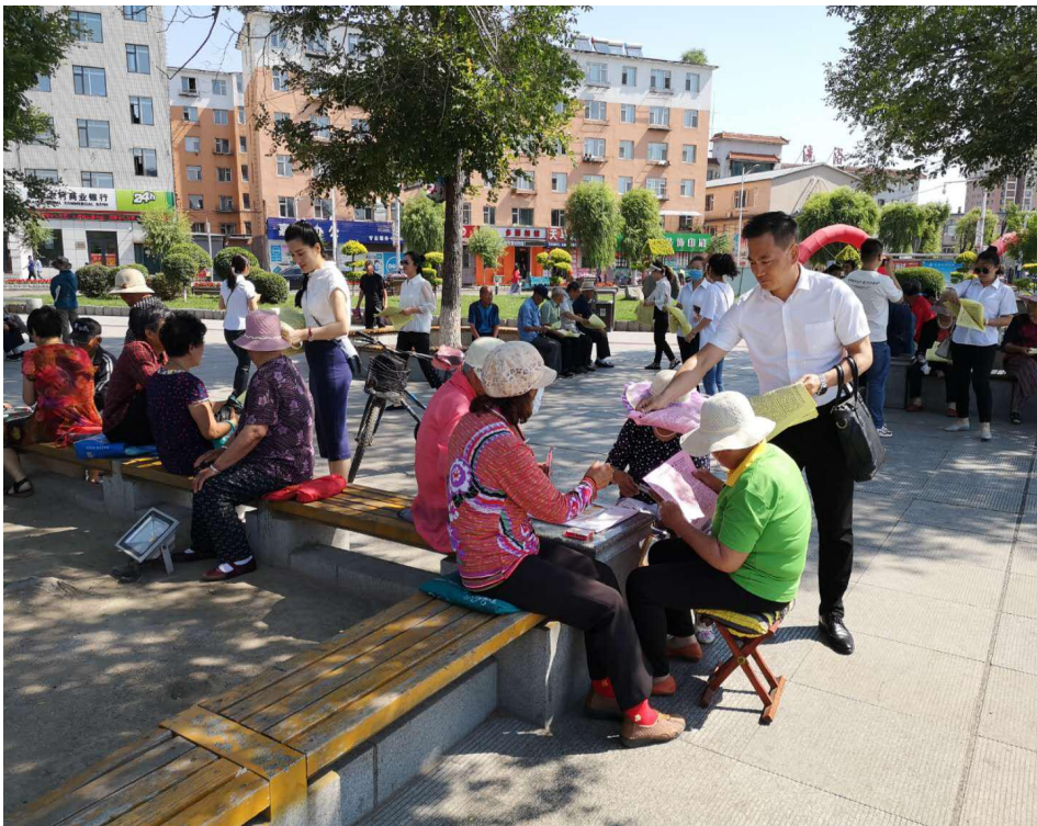
在人民广场发放宣传单