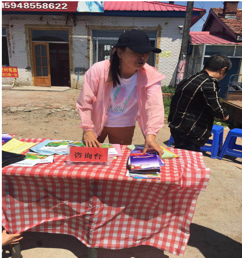
国土所设置咨询台